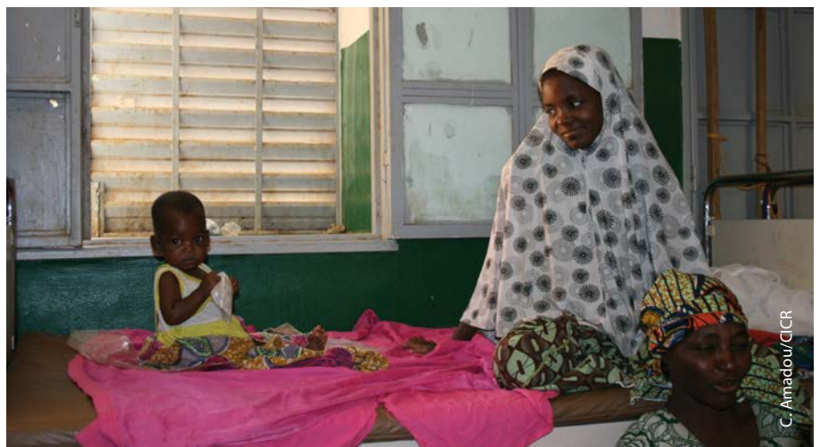
Hospital Regional, Gao, Malí. Una mujer con su hijo enfermo.

Además, a más largo plazo, es importante sensibilizar a las autoridades políticas sobre el problema de la violencia contra el personal y las instalaciones de salud y los pacientes. También sería muy importante lograr la participación de las comunidades locales en las cuestiones de salud, por ejemplo a través de comisiones en las que participen los dirigentes comunitarios, a fin de familiarizarlos con el hecho de que las instalaciones de salud deben ser respetadas.