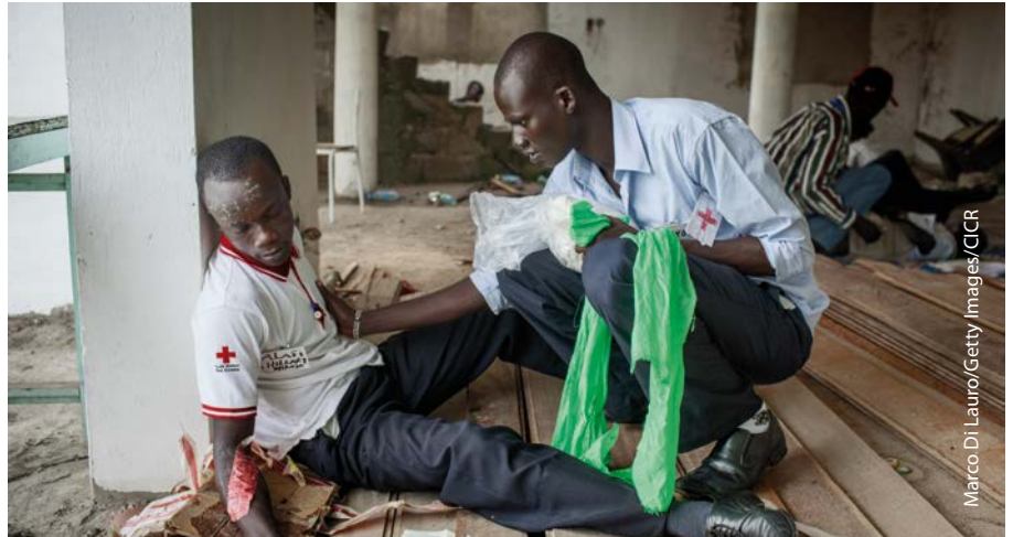
Juba, Sudán del Sur. Voluntarios de la CRSS en un curso para instructores de primeros auxilios.

¿Cómo hacen frente al brote de cólera los agentes de salud y los voluntarios de la Cruz