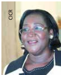
Profesora Thérèse Aya N'Dri-Yoman, ex Ministra de Salud y Prevención del HIV/SIDA de Côte d'Ivoire

Tras los polémicos resultados de las elecciones de 2011 en Côte d'Ivoire, se desató en el país una ola de manifestaciones violentas y arrestos, y muchas personas debieron abandonar sus hogares. El deterioro de las condiciones de seguridad impactó gravemente en el acceso de heridos y enfermos a la asistencia de salud. Entrevistamos a Thérèse Aya N'Dri-Yoman, ex Ministra de Salud y Prevención del HIV/SIDA de Côte d'Ivoire, para conocer su opinión sobre la mejor manera de superar los obstáculos que se interponen a la asistencia de salud.