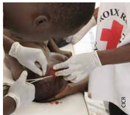
Sede de la Sociedad Nacional, Abiyán, Côte d'Ivoire. Socorristas de la Cruz Roja de Côte d'Ivoire suturan la herida de una persona lesionada en los enfrentamientos.

Por más de una década, el personal de salud de Côte d'Ivoire tuvo que desempeñarse en un clima general de violencia, ya que el país vivió crisis y conflictos armados en repetidas ocasiones. A veces, el personal fue víctima de la violencia; otras veces, cometió actos de violencia. Considerando esas experiencias, el Consejo Nacional de la Profesión Médica de Côte d'Ivoire decidió elaborar un documento al respecto, con aportes del CICR. Se trata de un primer paso excelente para que el personal de asistencia de salud esté mejor preparado y capacitado para actuar adecuadamente en situaciones peligrosas. El documento consta de una serie de recomendaciones prácticas para médicos, sobre todo, pero también para las autoridades y los portadores de armas. Contiene directrices, acordes al código de conducta de la Asociación Médica Mundial, que especifican las obligaciones del personal médico. En particular, se le recuerda que debe respetar el código ético médico mundial, según el cual se debe atender a todos los pacientes sin distinción. Esta colaboración entre un organismo médico nacional y el CICR resultó muy fructífera y se podría repetir en otros países.