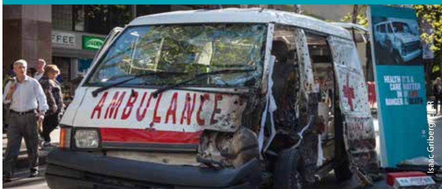
Réplica de ambulancia incendiada.

El proyecto Asistencia de salud en peligro se analizó en el Consejo de Delegados en Sydney. En el Consejo, que se celebra cada dos años, se reúnen miembros de nivel gerencial del Movimiento Internacional de la Cruz Roja y de la Media Luna Roja para debatir sobre retos humanitarios significativos y actuales. Más de 150 miembros de Sociedades Nacionales de la Cruz Roja y de la Media Luna Roja intercambiaron mejores prácticas y dilemas relativos a la prestación de asistencia de salud. Recomendaron medidas para mejorar la seguridad de sus voluntarios y se comprometieron a promover un mayor acceso de todos a la asistencia de salud. Además, se celebró un evento paralelo público para subrayar la cuestión. En el pacífico sitio de Darling Harbour, en Sydney, se colocó una ambulancia incendiada, con perforaciones de balas y las puertas arrancadas por una explosión, para impactar a los transeúntes. Durante la conferencia, se presentó una nueva publicación sobre ambulancias en situación de riesgo (p. 3).